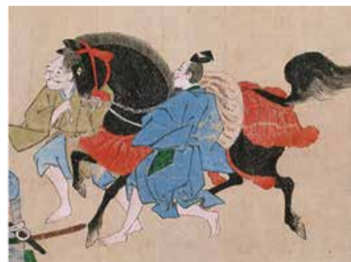
合戦絵巻 部分(横浜市歴史博物館蔵)