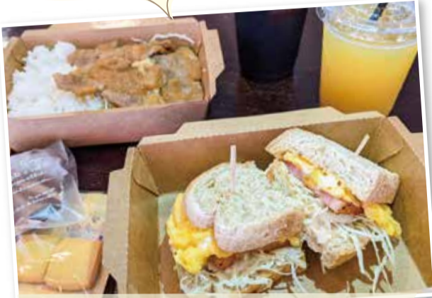
アスタ カフェ Asuta Cafe えだきん商店会