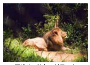
画像は一昨年の様子です

■ ナイトズーラシア 普段は見る事ができない夜の動物園を公開します! / 8月1日~29日の土・日曜と8月9日(休・月) 開園時間を20時まで延長(入園は18時30分まで)/ 画