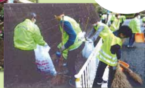
▲ハマロード・サポーター

個人や少人数で清掃などのまちづくりボランティアをしてみたいという人への支援もあります。土木事務所にお気軽にご相談ください。