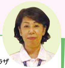
中川地域ケアプラザ 生活支援コーディネーター

生活支援コーディネーターとして1年が経ちましたが、地域の皆さんより声をかけていただく事がとても嬉しく、元気を貰えます。再開を喜ぶ声も聞かれ、人とのつながりの大切さを改めて実感しています。このような地域の居場所があることをもっとたくさんの方に知ってもらい、いつまでも笑顔で元気に暮らし続けていくことができるまちづくりのお手伝いをしていきたいと思ひます。