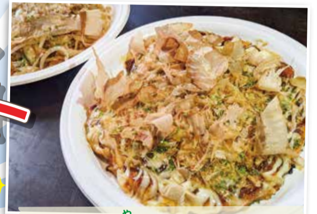
もんじゃ焼き くら 川和商店街