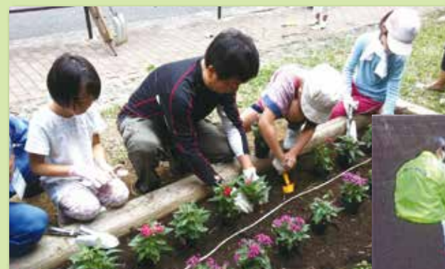
▲公園愛護会・水辺愛護会

道路や公園・緑道、水辺をより快適な空間にし、豊かな緑をきめ細かく維持・管理していくために、地域を中心としたボランティア団体の皆さんにご活躍いただいています。