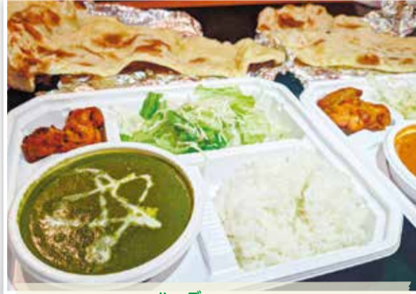
ハーブ スパイスHUB 仲町台商業振興会