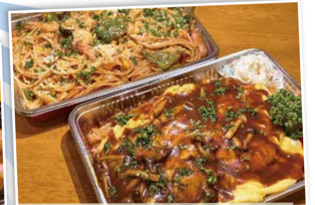
じゆうてい 自由亭 仲町台商業振興会

※取材に際しては、各商店街・商業振興会より店舗をご紹介いただきました。ご協力ありがとうございました。