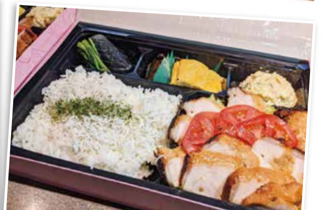
きたがわ 喜多川 中川駅前商業地区振興会