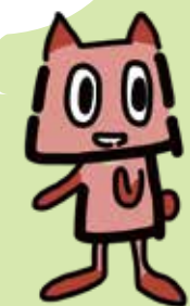
公園愛護会キャラクター あいごぼん

個人や少人数で清掃などのまちづくりボランティアをしてみたいという人への支援もあります。土木事務所にお気軽にご相談ください。