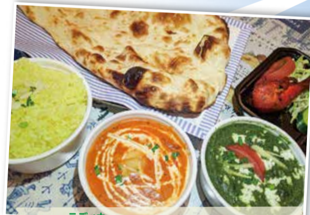
ラディカ RADIKA 北山田商業振興会