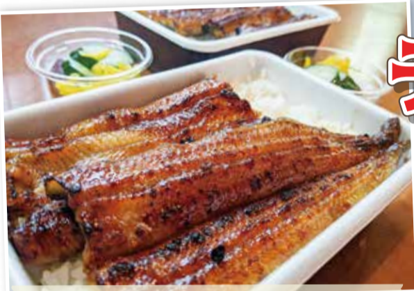
さわひで 沢栄 センター南商業地区振興会