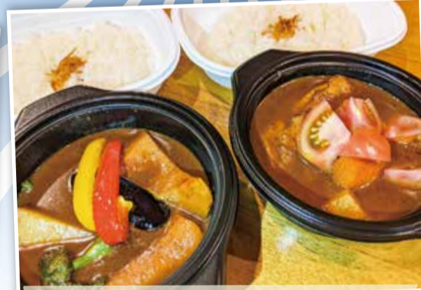
アジョワン Ajowan センター北商業振興会