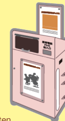
Sammelbox (Abbildung ähnlich)

Hinweis - Bitte Löschen Sie jegliche persönliche Informationen von entsprechenden Geräten. - Bitte entfernen Sie Batterien und Akkumulatoren vor dem Einwurf. - Bitte beachten Sie beim Entsorgen der zuvor genannten Gegenstände bei am lokalen Wertstoffhof die entsprechende Trennung. Diese fallen nicht unter Elektrokleingeräte.