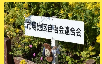
地元の方々がお世話をしています

鶴見川橋の近くの川沿いにあるリバーサイドガーデン。 3月頃、菜の花が満開を迎え、川沿いをきれいに彩ります。 地元の市場地区自治会連合会の皆様が、川沿いの美しい景観 をつくろうと始めたのがきっかけ。青い空と一面の菜の花色の コントラストがキレイです。