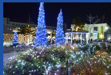
イルミネーションの様子