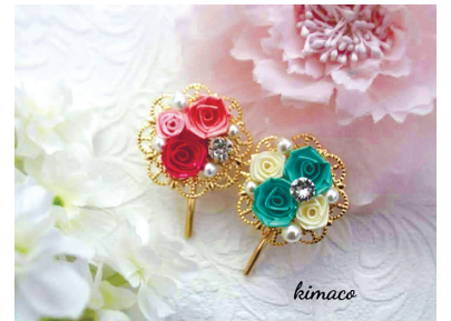
ロザフィは紙で作るバラのアクセサリーです

①ロザフィで作るアクセサリー ▶ ポニーフックかネックレスのどちらかとマスクチャームを作ります 9月7日(水) 9時30分～11時 11時30分～13時 成人 先各4人 ¥1,000円 申8月12日9時30分から 窓