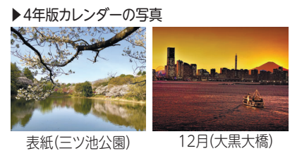
表紙(三ツ池公園) 12月(大黒大橋)

令和5年版「鶴見区自治連合会カレンダー」に使用する区内各所の写真を募集します 申8月1日(月)～24日(水)までに 必要事項、メールアドレス、写真(1人3枚まで※過去に撮った写真も可)、撮影場所、撮影時期、写真にまつわるエピソード(任意)などを記入し、①ウェブページから②写真データを保存したCD-Rなどのメディアを 窓か 申 問 鶴見区自治連合会事務局(区役所5階2番) 510-1687 fax 510-1892