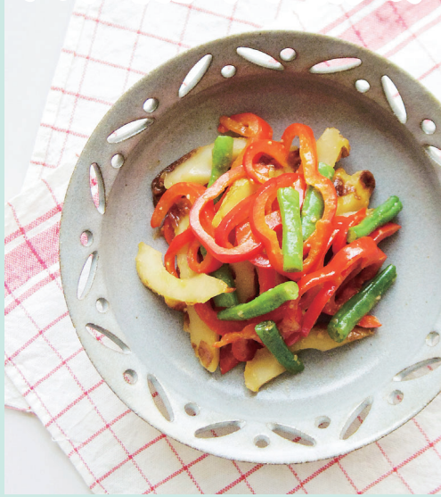
食卓を彩り、甘辛味でお箸が進む！