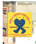
▲目印のステッカー

コンビニエンスストア、ファミリーレストラン、ガソリンスタンドなどの店舗で支援を受けられます。 ・水道水、トイレの提供 ・地図などによる道路情報、ラジオなどで知り得た災害に関する情報の提供 ・一時的な休憩の場の提供