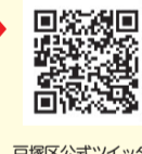
戸塚区公式ツイッター