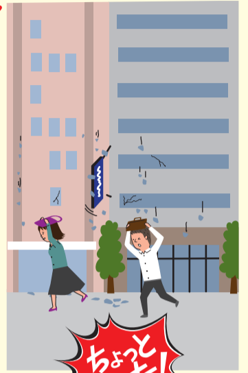
東日本大震災時の横浜駅周辺の状況