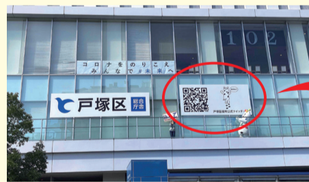
▲JR戸塚駅ホームからも読み取れる二次元コード

リアルタイムに情報収集ができるSNSは災害時にはとても有効ですが、デマなどの情報が含まれていることもあります。行政など信頼性の高いところからの情報収集が重要!