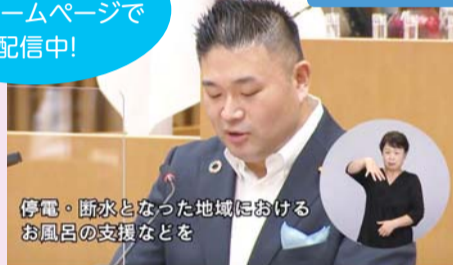
停電・断水となった地域におけるお風呂の支援などを