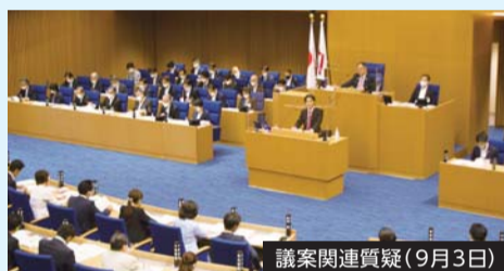
議案関連質疑(9月3日)

令和2年第3回市会定例会が9月3日から10月14日まで開催されました。(2面及び3面に一般質問の一部を掲載しています。)