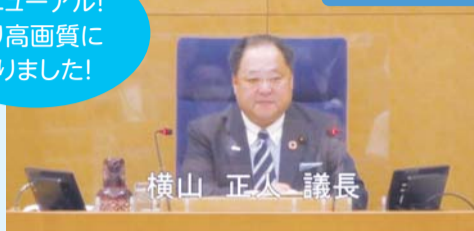
横山 正人 議長