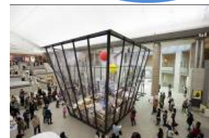
ヨコハマトリエンナーレ2014 マイケル・ランディ 《アート・ビン》2010/2014