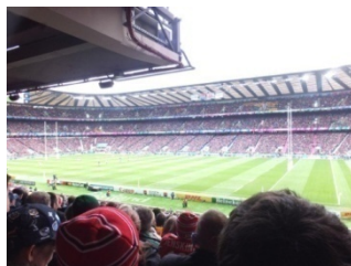
トゥイッケナム・スタジアム (イングランド)