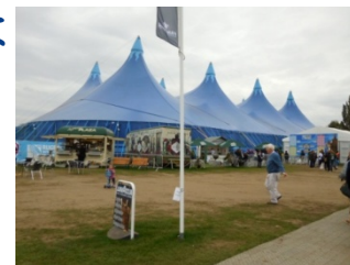
リッチモンド/オールドパーク ファンゾーン (イングランド)

公共のエリアでパブリックビューイングなどラグビーファン向けにラグビーワールドカップに関する体験を提供するスペース。