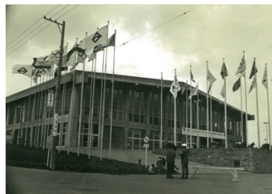
国旗などがはためく1964年大会時の横浜文化体育館

前回の東京大会では、三ツ沢公園球場でサッカー競技が、横浜文化体育館ではバレーボール競技が開催されるとともに、大会開催に合わせて「オリンピック理解運動」や「国際理解運動」など、様々な市民活動も行われました。