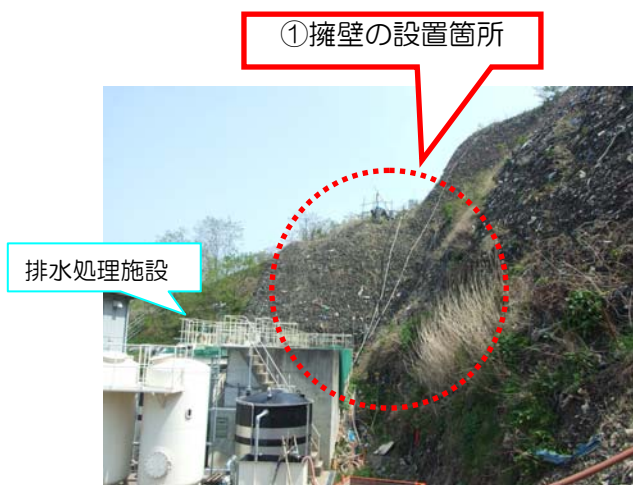
図2 擁壁の設置箇所（写真）