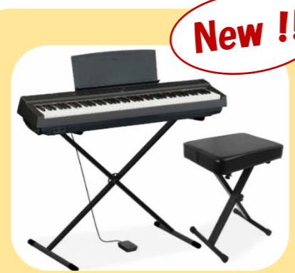
キーボード(88鍵) (キャリングケース・折り畳み椅子付き)