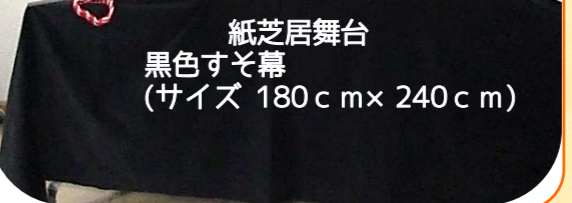
紙芝居舞台 黒色すそ幕 (サイズ 180cm x 240cm)