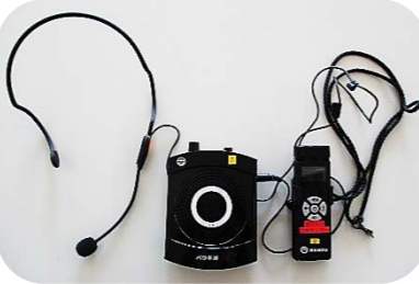
パワギガ(手ぶら拡声器) 充電式で屋外でもウォーキングや読み聞かせに大活躍!