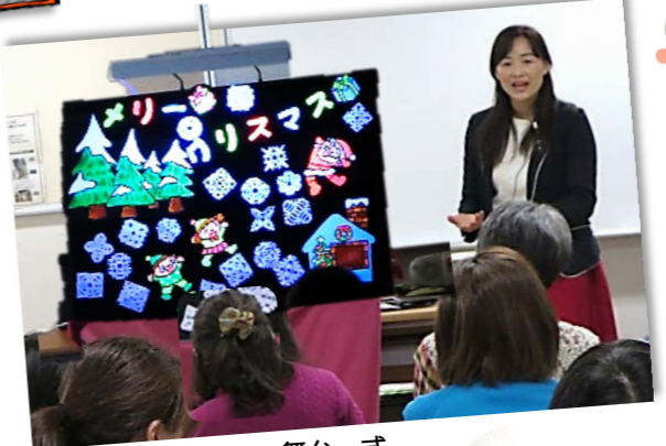
パネルシアター舞台一式 ブラックシアター・ブラックライト