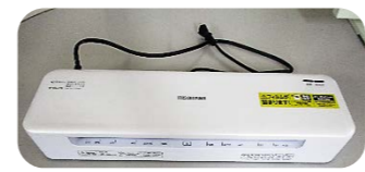
ラミネーター (ラミネートフィルムはご持参ください)