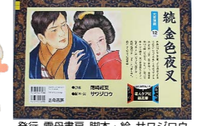
発行 雲母書房 脚本・絵 サワジロウ