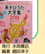
発行 永岡書店 編者 細田淳子