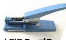
大型ステープラー (ホチキス)