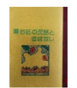
瀬谷区の民話と昔ばなし