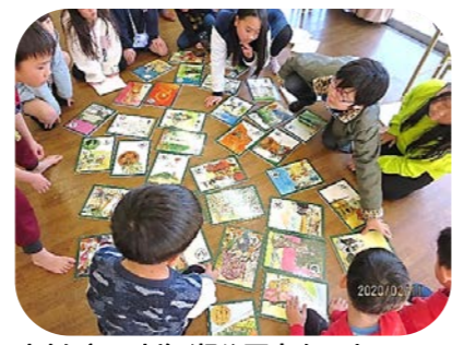
大判(A4判)瀬谷歴史かるた いつもと違ったかるたで大盛り上がり!