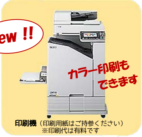
印刷機 (印刷用紙はご持参ください) ※印刷代は有料です