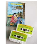
カセットテープセット