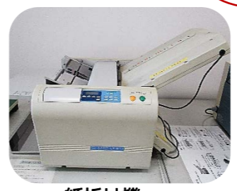
紙折り機 (2つ折り・3つ折りなど)