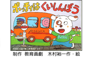
制作 教育画劇 木村裕一作・絵