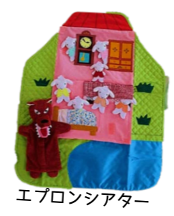
エプロンシアター