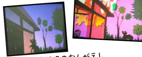
たぬきのおんがえし