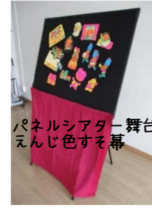
パネルシアター舞台 えんじ色すそ幕