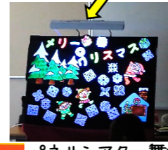
パネルシアター舞台を照らすライト