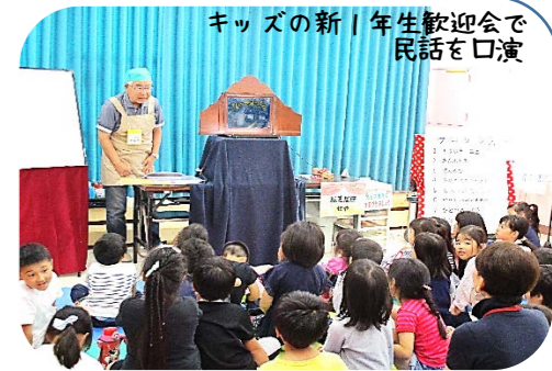
キッズの新年生歓迎会で民話を口演