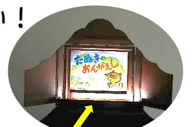
紙芝居を照らすLEDライト