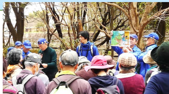
ふるさと民話の会制作の民話紙芝居を披露

今後も障がいのある方をはじめ、地域の皆様と楽しくウォーキングできるような企画を継続していきたいです。