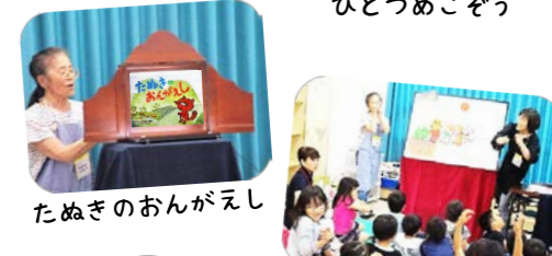
たぬきのおんがえし