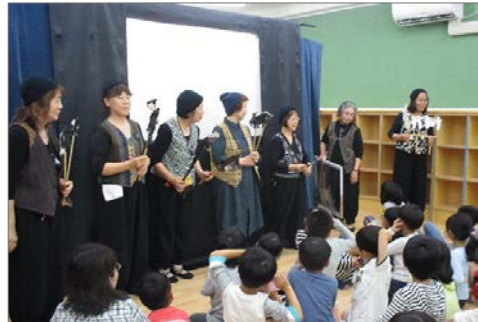
公演後に影絵の説明をするメンバー

瀬谷区の民話を影絵劇で表現し、語り継いでいくことを目的として、現在7名で活動しています。