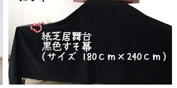
紙芝居舞台 黒色すそ幕 (サイズ 180cm×240cm)