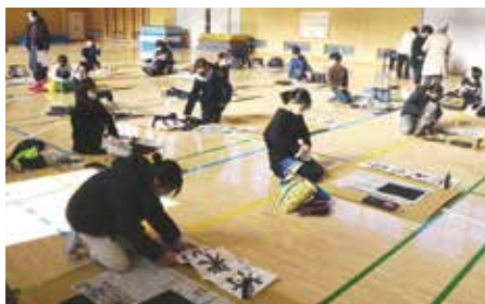
冬休み習字教室は、 密を避けて小学校の体育館で

ボランティアや学生、地区社会福祉協議会などが協力して、将棋・習字教室や青空自由教室を開催しています。「お父さんお母さん気にしないで。こどもたちは地域と一緒に育てるんです。」という気持ちでやっています。こどもたちの成長を願い、コロナ禍でも元気に集える場をつくっていきたいです。