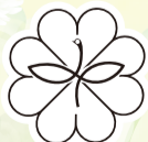
民生委員・児童委員 のマーク

現在、瀬谷区には約170人の民生委員・児童委員がいます。 活動の任期は3年で、今年の11月30日に現在の任期が満了となるため、 12月1日に一斉に改選されます。 民生委員・児童委員は、社会福祉に理解がある人など、地域で推薦された 候補者が、市の推薦会などを経て、厚生労働大臣から委嘱されます。