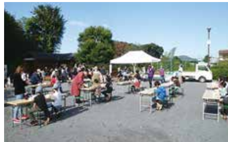
感染対策をしっかり行い、 大カレーパーティー開催

地域で協力し合い、工夫しながら大カレーパーティーを開催しました。家族みんなで食べに来てくれる家庭が多かったですね。おかわり! の声が飛び交い、作りたてのものをみんなで食べるのが楽しい、という気持ちがあふれていました。地域みんなの強みを生かして、こどもの声があふれるまちにしていきたいです。