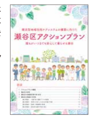
▲瀬谷区アクションプラン冊子

瀬谷区地域福祉保健計画と瀬谷区アクションプランが相互に連動することで、高齢者の生活を支える地域づくりを進めています。詳細は、瀬谷区アクションプラン冊子をご覧ください。※冊子は、区役所4階40番窓口、区内地域ケアプラザ等で配布しています。