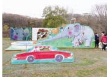
※写真はおとこの様子です。