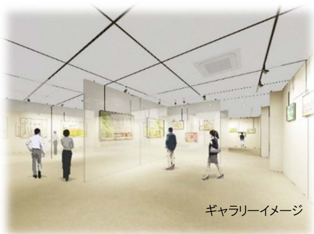
ギャラリーイメージ

瀬谷区在住、在勤、在学の皆さんから寄せられた、201作品の中から選考委員の審査により、区の花「アジサイ」にちなんだ愛称に決定しました。 たくさんのご応募ありがとうございました。