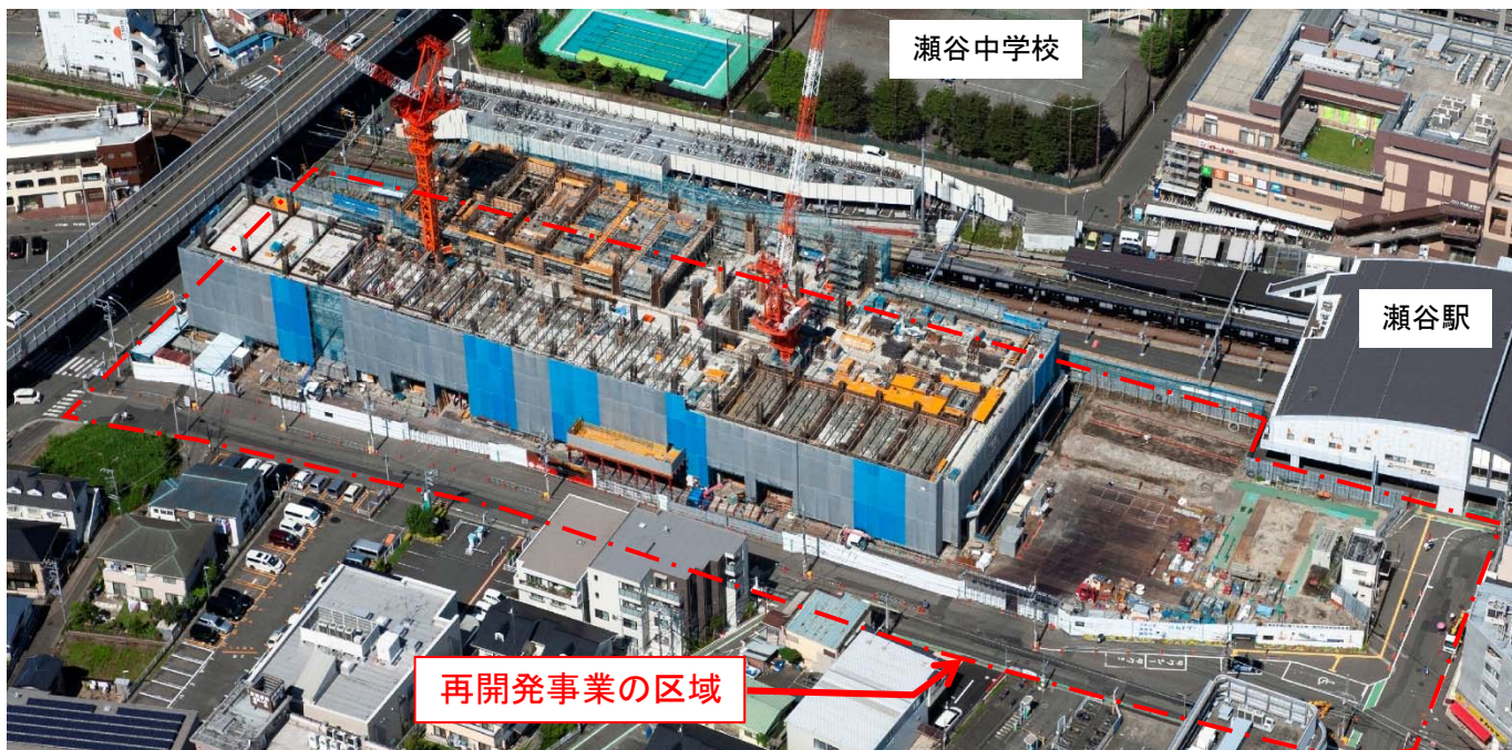
航空写真（令和2年9月）