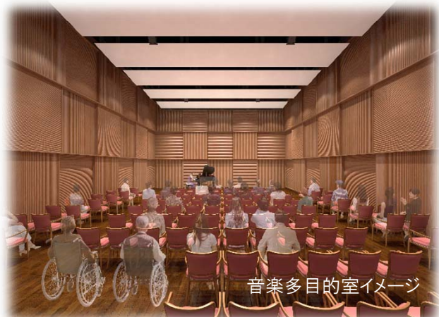
音楽多目的室イメージ