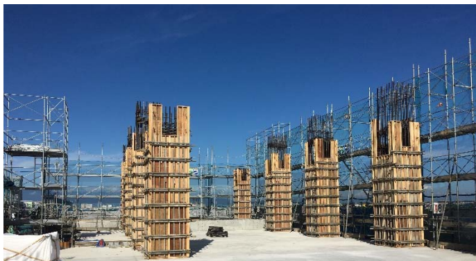
工事の様子：3階部分（令和2年）

区民文化センターが整備される予定の「瀬谷駅南口第1地区第一種市街地再開発事業」の再開発ビル建築工事は、令和元年8月に着工し、令和3年度の完成を目指して工事が進んでいます。現在、建築工事は順調に進み、建物が立ち上がっています。今後、区民文化センターの設備・内装工事が行われる予定です。