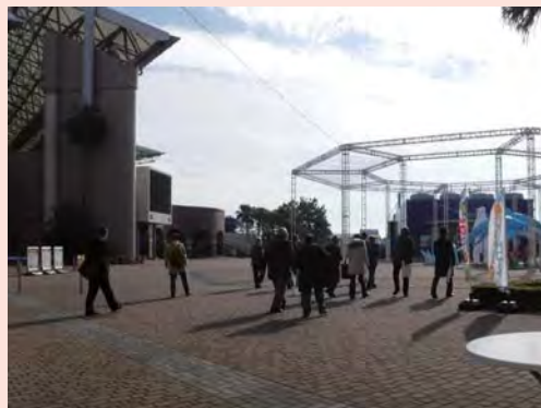
横浜・八景島シーパラダイス