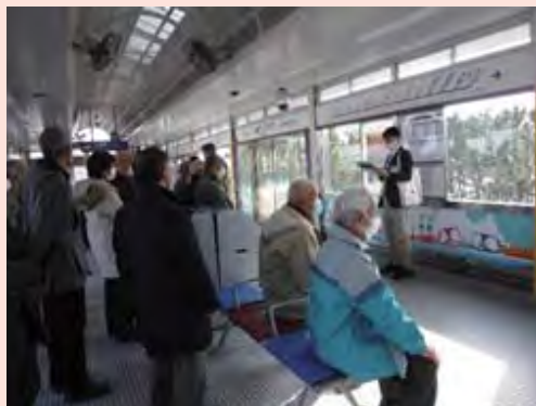
シーサイドライン八景島駅