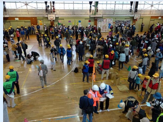
地域防災拠点訓練（三ツ境地区）

地区連合町内会自治会ごとに構成された地区支援チームのメンバーが各地区の定例会等に出席して意見交換をしたり、地域の行事のお手伝いをさせていただくことで、日常的に地域と区役所をつなぎます。地域での課題や関心ごと、実情などを情報収集し、必要に応じて、所管課・関係機関にお伝えしますので、自治会町内会活動や子育て、高齢者支援に関することなど、お気軽にご相談ください。