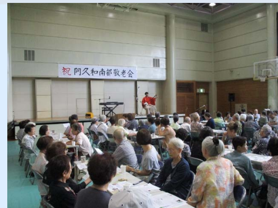
敬老会（阿久和南部地区）