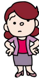
町内会長5年目のBさん

災害時に、高齢者を健康面に配慮しながらサポートするようなシステムを作りたいわ。役所に相談するとしたら、防災の窓口？それとも福祉の窓口？役所は「縦割り」だから、どこに相談すればいいかよく分からないのよね・・・。補助金が出るかどうかも知りたいわ。