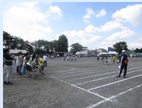
レクリエーション大会（瀬谷北部地区）