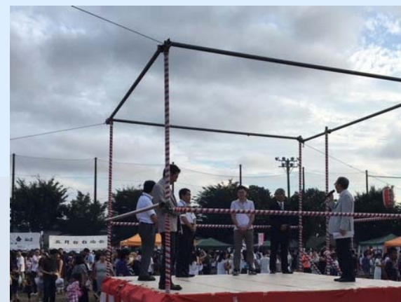
連合まつり（南瀬谷地区）