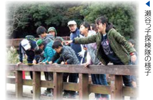
瀬谷っ子探検隊の様子

人と人の温かいふれあいがある瀬谷で、子どもたちが夢と希望を持って成長できるよう、私たち青少年指導員が支援していきます。