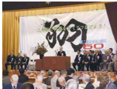
瀬谷第二地区連合自治会 創立50周年記念式典

問合せ 瀬谷区役所地域振興課(TEL: 367-5691 FAX: 367-4423)