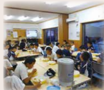
▲瀬谷北部地区 子ども食堂 初めての開催でしたが、たくさん子どもたちが参加してくれました。今後も継続して開催していきます。