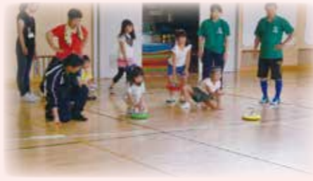
▲瀬谷第四地区 カラーリング大会 年に一度のカラーリング大会。誰でも気軽に楽しくできるスポーツの普及をしています。