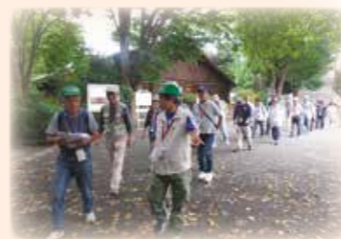
▲本郷地区 レインボーウォーキング 「健康長寿の里：本郷 85歳を元気で迎えよう!」をスローガンに掲げウォーキングに励んでいます。