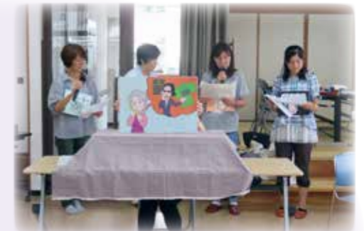
▲南瀬谷地区 地域のサロンでの啓発講座 紙芝居を使って、高齢者の消費者被害を防止するための講座を開催しています。