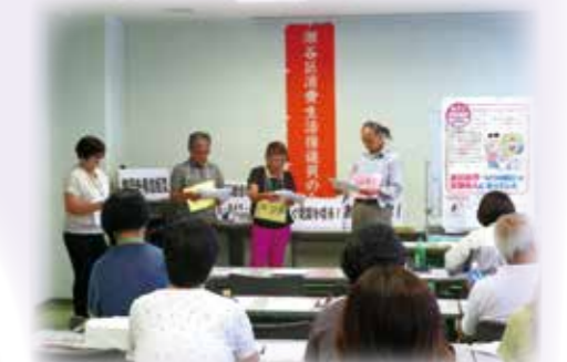
▲瀬谷第二地区 悪質商法対策講座 悪質商法の手口を分かりやすく伝える寸劇を行い、被害防止の啓発を行っています。