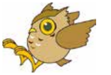
瀬谷区マスコットキャラクター 「せやまる」

皆様のお住まいになっている地域に、自治会町内会から推薦を受けて、地域のためにさまざまな活動をされている委嘱委員*の皆様がいらっしゃるのをご存知ですか？