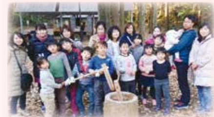
▲相沢地区 野外炊事体験 薪割り、豚汁づくり、餅つきなどのレクリエーションを通じて、地域の絆を深めました。