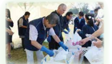
▲瀬谷フェスティバル ごみステーションの運営を通じて、分別啓発をおこなっています。