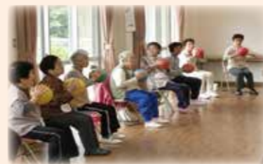
▲細谷戸地区 はつらつクラブ 楽しく、元気でいるために体づくりと仲間づくりを進めています。