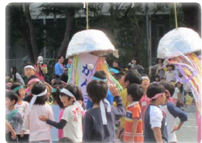
地区連合町内会の運動会の様子

このような取組は、自治会・町内会の枠を超えたつながりを作ることができ、いざという時に大切になります。