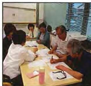
【 所内の事故予防研修 】

研修内容：事故予防研修・感染症研修・認知症ケア研修・マナー接遇研修・虐待防止研修等