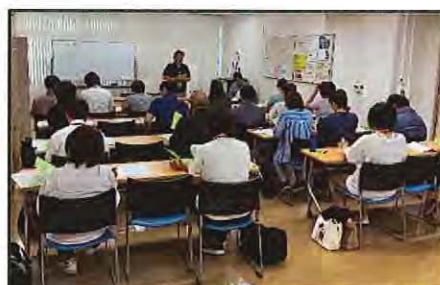
【 新任ケアマネジャー研修 】