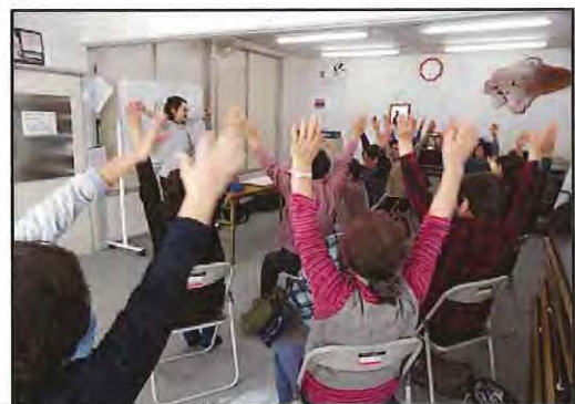
【 GOGO健康づくり教室 】