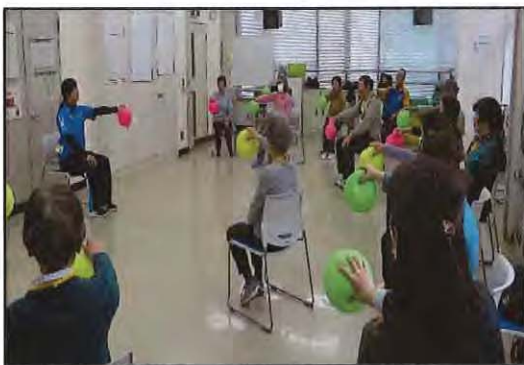
【 元気づくりステーション 】

ボランティア活動の担い手の高齢化・固定化により、活動の継続が難しくなっていくことが考えられるため、次世代の発掘・育成に向けた講座を開催していきます。