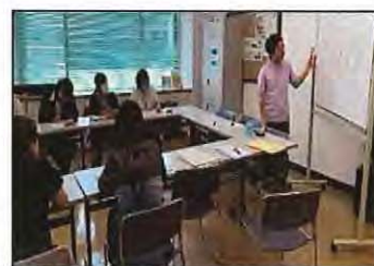
【 医療知識の勉強会 】

また、多職種連携を目的とした勉強会等を開催し、医療と介護が連携したケアマネジメントが実践できるよう支援していきます。