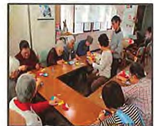
【レクリエーション 活動の折紙グループ】