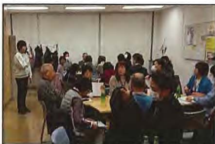
【 民生委員児童委員とケアマネジャーとの交流会 】