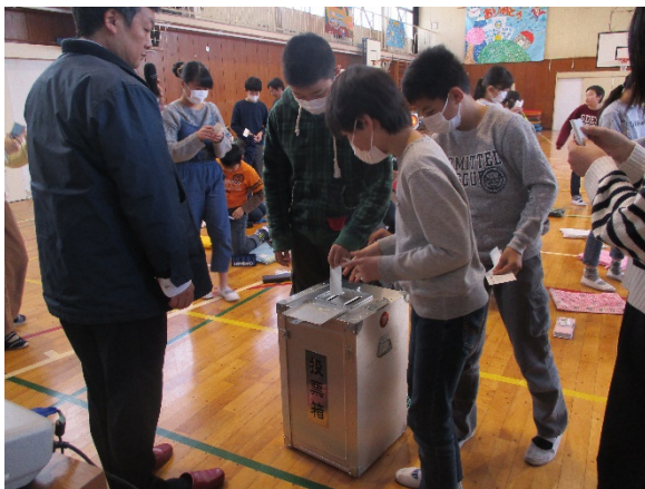
先生の熱弁を参考に投票する小山台小児童たち

児童の皆さんは、担任の先生方が候補者のデザートの魅力を伝える演説をじっくり聞いて、3月の給食に出る(かも知れない)食べたいデザートを選んで投票していました。