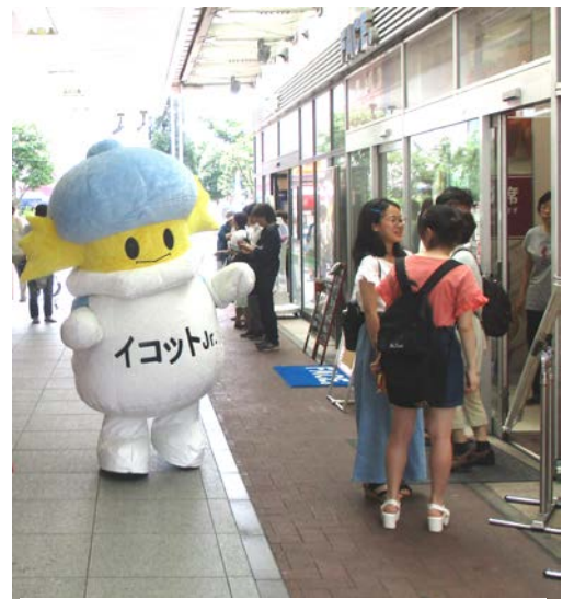
↑ 投票を呼びかけるイコット Jr.

また、今回の選挙についても期日前投票所や開票所において明るい選挙推進協議会の皆様にご協力をいただきました。