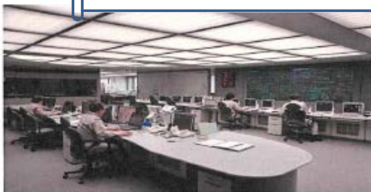
東京ガス供給指令センター