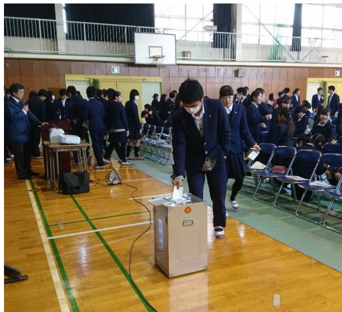
卒業を前に投票を体験していただきました

また、「栄区長選挙」と題して、選挙公報を基に判断し、投票を体験していただく模擬投票を実施しました。