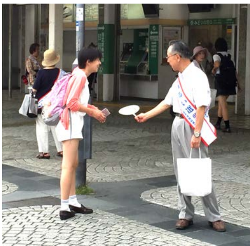
↑ 本郷台駅で投票を呼びかけ

今回の横浜市長選挙啓発のため、7月22日に港南台駅と同月24日に本郷台駅で明るい選挙推進協議会の皆様にご協力いただきました。当日は駅を利用する方に選挙をPRするうちわを配り、投票を呼びかけました。