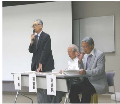
↑ 臼井会長のごあいさつ