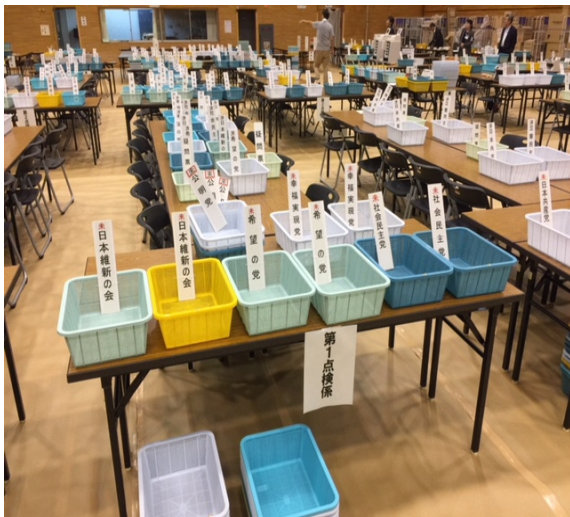
開票所の横浜市栄スポーツセンター第一体育室

平成29年10月22日(日)に行われた第48回衆議院議員総選挙につきましては、明るい選挙推進協議会推進委員・推進員の皆様のご協力により、滞りなく終了することができました。