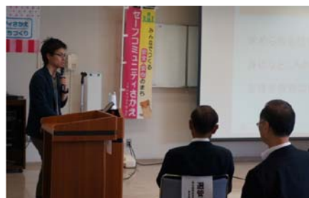
第二部 講演会の様子

「18歳選挙権時代の作り方」と題して、若者にとって政治を身近なものにする方法の提案や主権者教育の担い手を増やすことへの想いをお話しいただき、大変、参考となりました。