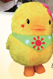
ぬくもりのマスコット ぬくっぴー