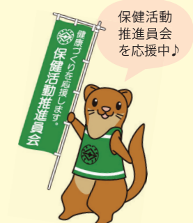
栄区いたち川マスコット タッチーくん

地域の健康づくりの推進役で、行政の健康づくり施策のパートナーです。健康づくりを自ら実践し、周囲の皆さんへ広め、地域全体で健康づくりに取り組めるよう活動しています。