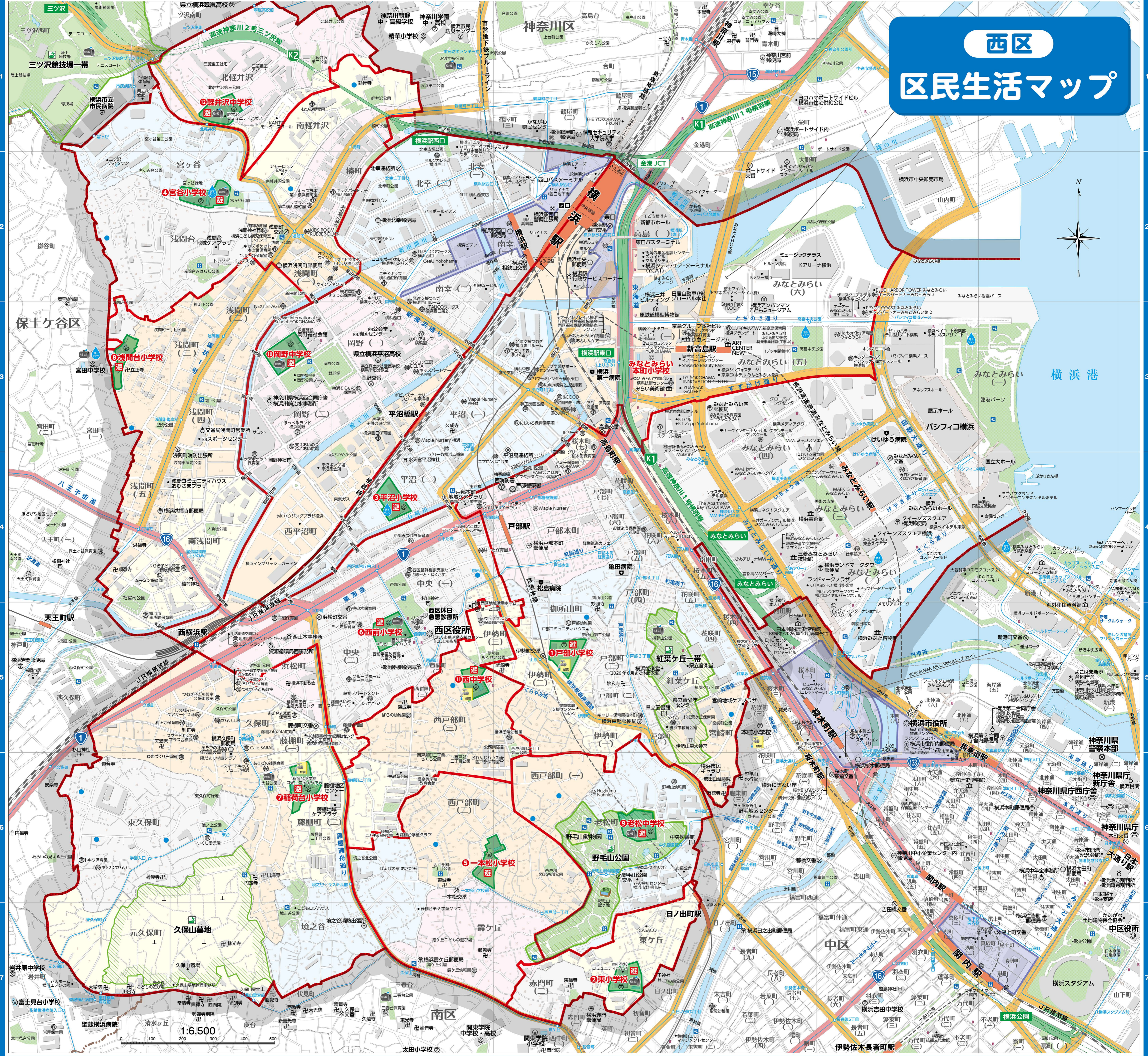
地図制作：昇野チャート株式会社 測量法に基づく国土地理院長承認（使用 R.6.Hs.421）