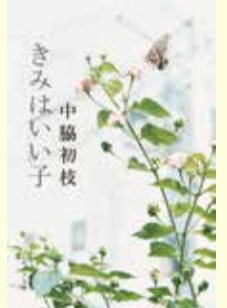
著書「きみはいい子」