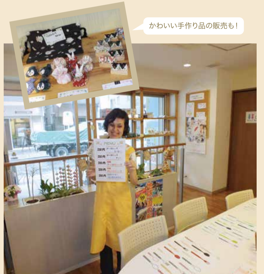
かわいい手作りの販売も!