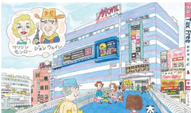
題字・絵・文：鈴木太郎(西区文化協会)

最終直後の西区には、藤棚周辺に「浜富士館」や「藤棚中央劇場」などの2本立ての映画館があった。ジョン・ウェイン主演の西部劇などをワクワクして見たものだ。娯楽が少なかった時代だったので大人気で、今半と言われていた、入場料の半額で見られるサービスもあった。 昭和31(1956)年、横浜駅西口に横浜駅名品街が誕生して、封切映画館ができた。そして昭和46(1971)年、今の横浜ベイシエラトンホテルの所に、映画館5館が入った「相鉄ムービル」が誕生。それまで封切映画は伊勢佐木町方面に行っていたファンは、横浜駅西口へも見に行くようになった。 その後、「相鉄ムービル」は西口五番街を抜けて、青色の幸橋を渡った所に移り、名は「ムービル」となったが、今も映画ファンを集めている。