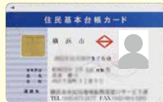
住民基本台帳カード

住民基本台帳カードの電子証明書を利用して確定申告をする人は、電子証明書の有効期間を確認の上、必要によりお早めに更新手続きをしてください。