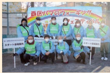
ハマのウォーキングフェスティバル