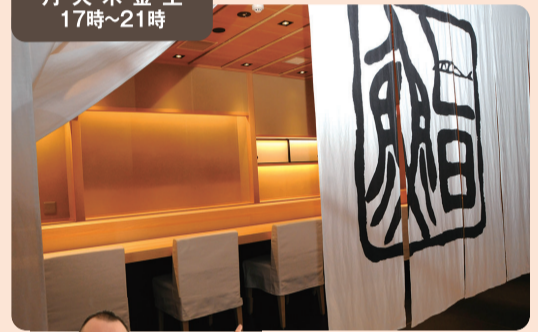
GRAND | SUSHI