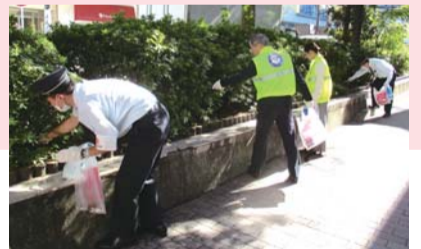
クリーンアップイベント

時代の移り変わりとともに、駅やそれを取り巻くまちの様子は変化を続けます。これからの横浜駅にもご期待ください。