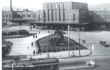
3代目横浜駅。「東洋一のモダンな停車場」ともてはやされました。⑦

震災復興計画や都市計画により、2代目横浜駅の難点(曲線上にプラットフォームがある、狭い駅前広場など)を解決すべく、位置を変えて建築されました。高い吹き抜けと広いコンコースを持つ、従来の駅にないモダンな設計でした。