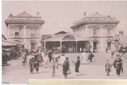
◀ 初代横浜駅。アメリカ人建築家R. P.ブリジエンスによる設計。①

1872(明治5)年に横浜～新橋間(29km)に鉄道が正式開業しました。鉄道開業前は馬車を使っても約4時間かかっていたところ、わずか53分で新橋に行けるようになりました。当時の駅舎は現在の桜木町駅付近にあり、鉄道創業の地を記念して記念碑が建てられています。