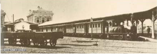
◀ 横浜駅構内に停車中の蒸気機関車。当時、横浜～新橋間を1日9往復し、海の上を走る蒸気船しか知らなかった人々は、陸を走る蒸気船という意味で「陸蒸気(おかじょうき)」と呼んでいました。②