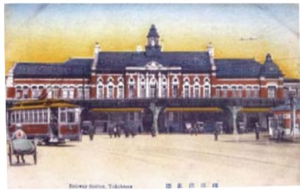
2代目横浜駅。洋風のクラシックな外観は、現東京駅と似た雰囲気をもっていました。④