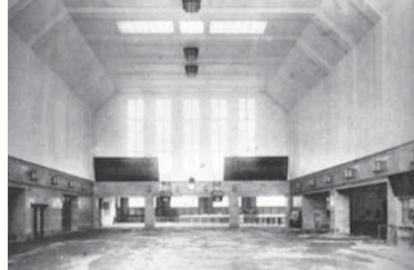
コンクリート造りの新駅舎は、高い吹き抜けが特徴でした。⑧