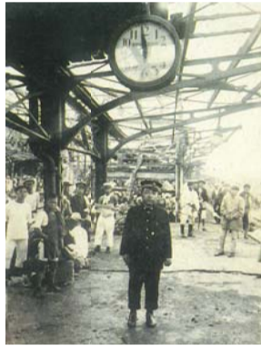
崩壊した駅のプラットフォームでは、時計が地震発生時刻(11時58分)で止まっています。⑤