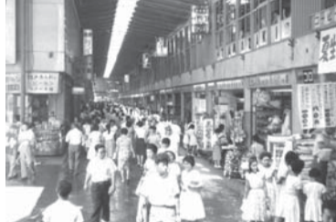
1956(昭和31)年、西口に横浜駅名品街がオープン。西口開発が本格化していきます。⑨