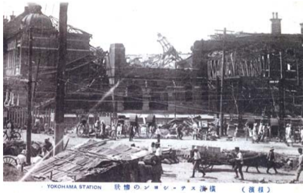
地震後に発生した火災で、外壁を残して焼失した2代目横浜駅。桜木町駅も同様に焼失してしまいました。⑥