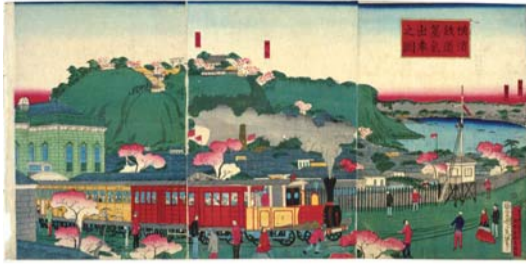
◀ 「横浜鉄道蒸気出車之図」(1873(明治6)年) 横浜駅を発車するところ。伊勢山皇大神宮が描かれ、平沼町一帯が内海になっています。③