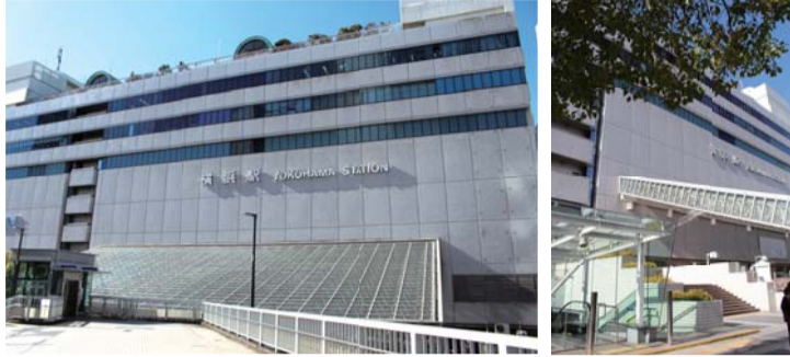
現在の横浜駅。1981(昭和56)年に横浜駅の東西を結ぶ自由通路(当時の日本最大幅36m)も駅ビル開業に続いて開通しました。これにより、東口と西口は一体となり、横浜駅周辺は大きく発展しました。