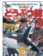
『りったいどうぶつ館パート3』 神谷正徳・作(小学館)