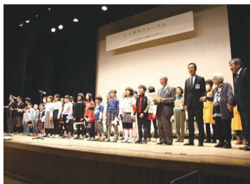
子どもも大人もみんなで「にこまちのうた」を大合唱