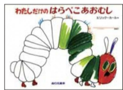
『わたしだけのほらべこあおむし』 エリック=カール・作 もりひさし・訳(偕成社)