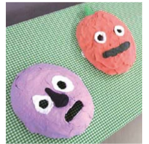
個性ある力作が そろいます