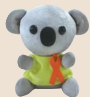
横浜市こども虐待防止シンボルキャラクター「キャッピー」

地域のみなさんへ 近所で「もしかして、虐待では?」と気になるこどもやご家庭があれば、通告・情報提供をお願いします。