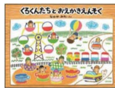
『ぐるぐるとおえかきえんそく』 なかやみわ さく・え (童心社)