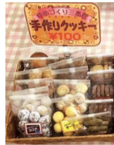
スノーボールクッキーが 人気です

②12月15日(土)～17日(月) 11時～17時 障害者地域活動支援センター「cafeあにみ」 (みなとみらい2丁目 クロス・パティオ1階)