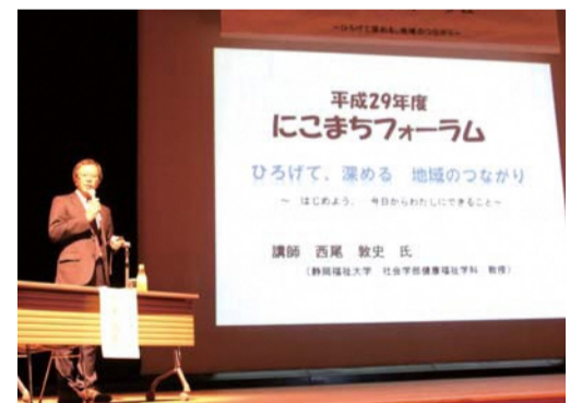
地域づくりの工夫のお話しも