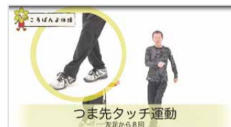
つま先かかとタッチ運動 (左足から8回)