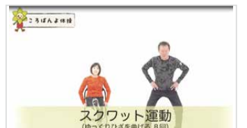
スクワット運動 (ゆっくりひざを曲げる8回)

「ころばんよ体操」は、DVDを区役所高齢担当またはお近くの地域ケアプラザで貸し出します(要予約)。区役所でDVDの焼き増しもできます。動画はインターネットで公開中