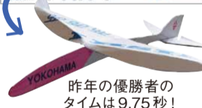
昨年の優勝者のタイムは9.75秒！