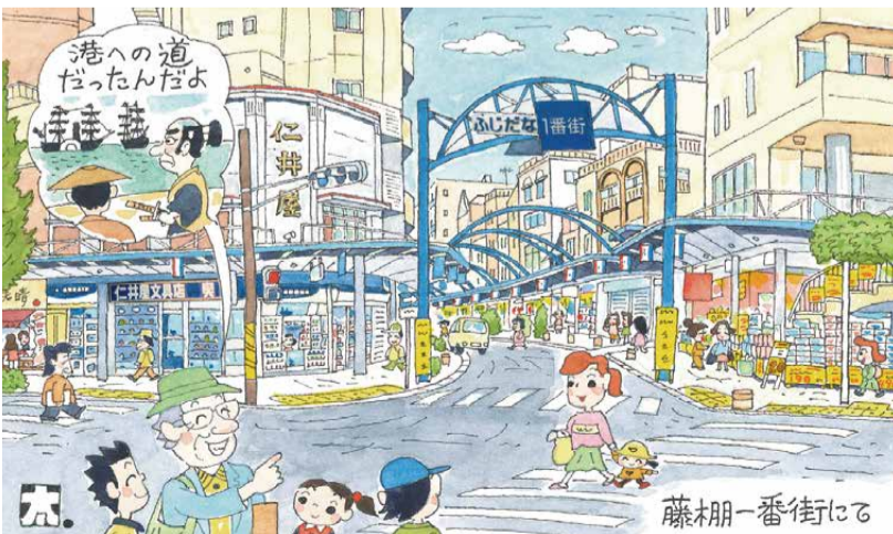
題字・絵・文：鈴木太郎(西区文化協会)

👤 成人 各先着35人 💰 6,100円(傷害保険料含む) 📅 10月20日(金)～ 費用持参で直接来館