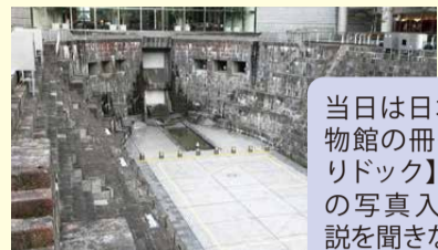
ドックヤードガーデン

当日は日本郵船歴史博物館の冊子【ハマの石造りドック】(当時のドックの写真入り)を手に、解説を聞きながら歩きます