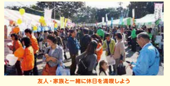
友人・家族と一緒に休日を満喫しよう