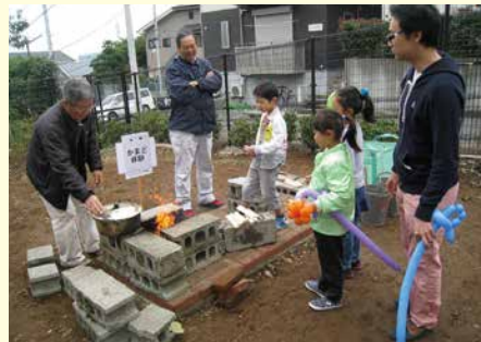
子どもも積極的に参加したかまど体験

東久保町の協議会では、平成19年に地域独自の防災計画を作成し、災害からまちを守るために活動を続けています。その中で定期的に住民が楽しみながら学べる「防災イベント」を行っています。平成28年10月のイベントでは、タオルやハンカチを玄関先につるした安否確認訓練や、炊き出し訓練を行いました。地域で整備している防災広場では、場所の周知を兼ねた、かまど体験や簡易トイレの設置を行いました。