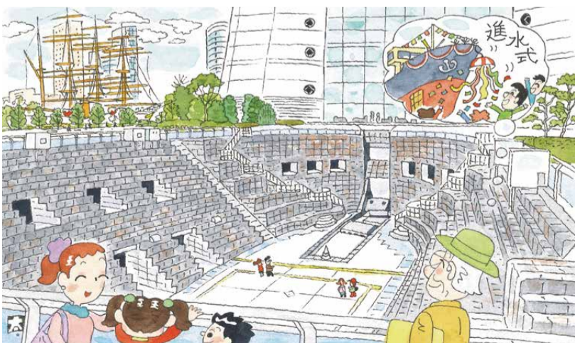
題字・絵・文: 鈴木太郎 (西区文化協会)

温故知新! 西区の歴史を掘り出す 【第二十三回】ドックヤードガーデン JR桜木町駅近くの横浜ランドマー クタワー横には、地下の周囲に大きな石 が段々に積み上がっている広場がある。 ここは旧横浜船渠第2号ドック(復元)だ。 隣の帆船日本丸の所が旧第1号ドック。 横浜が開港されて船の建造と修繕が 必要になり、明治29(1896)年に、こ の旧第2号ドックが旧第1号ドックよ り先に竣工した。以来、多くの船が建造 され修繕されたが、昭和48(1973)年 にドックとしての役割を終えた。 元ドックの広場に降りて見回すと、濃 い灰色の石組みひとつひとつに味わい がある。そして歴史が感じられる。フジ ツボがこびりついている石もある。かつ てここには海水が入られていたのだ。 私は西区で育ったが、ぜひ当時の造船 所を見たかった。ドックでの華やかな進 水式を見ておきたかった。ここは今、イ ベント広場になっている。