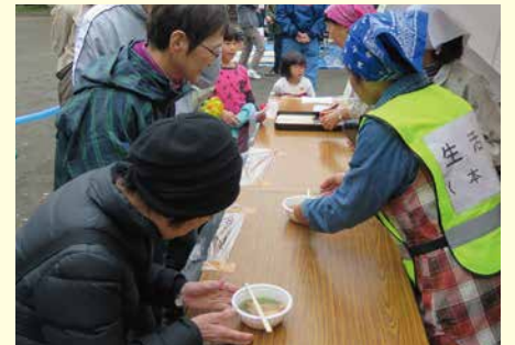
寒空の下、こだわりの“すいとん”を配布