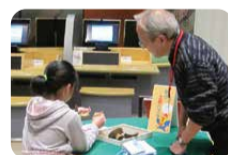
土器パズルに挑戦!