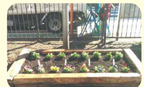
9 神明下公園 (浅間町2-109-12)