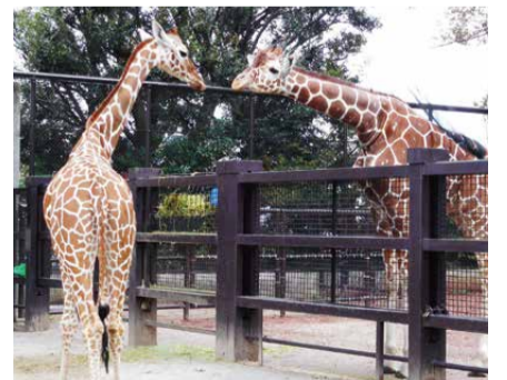
モミジ(左)とそら(右)

3月1日(水)～31日(金)に野毛山動物園で野生動物たちの現状を知ってもらう「動物たちのSOS展」を開催しています。詳しくはホームページをご覧ください。