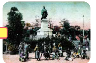
初代 井伊直弼像