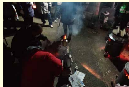
夜間に防災キャンプ ケリーケトルの湯沸かし体験中