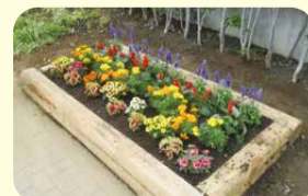
8 紅葉ヶ丘公園 (紅葉ヶ丘2-3)