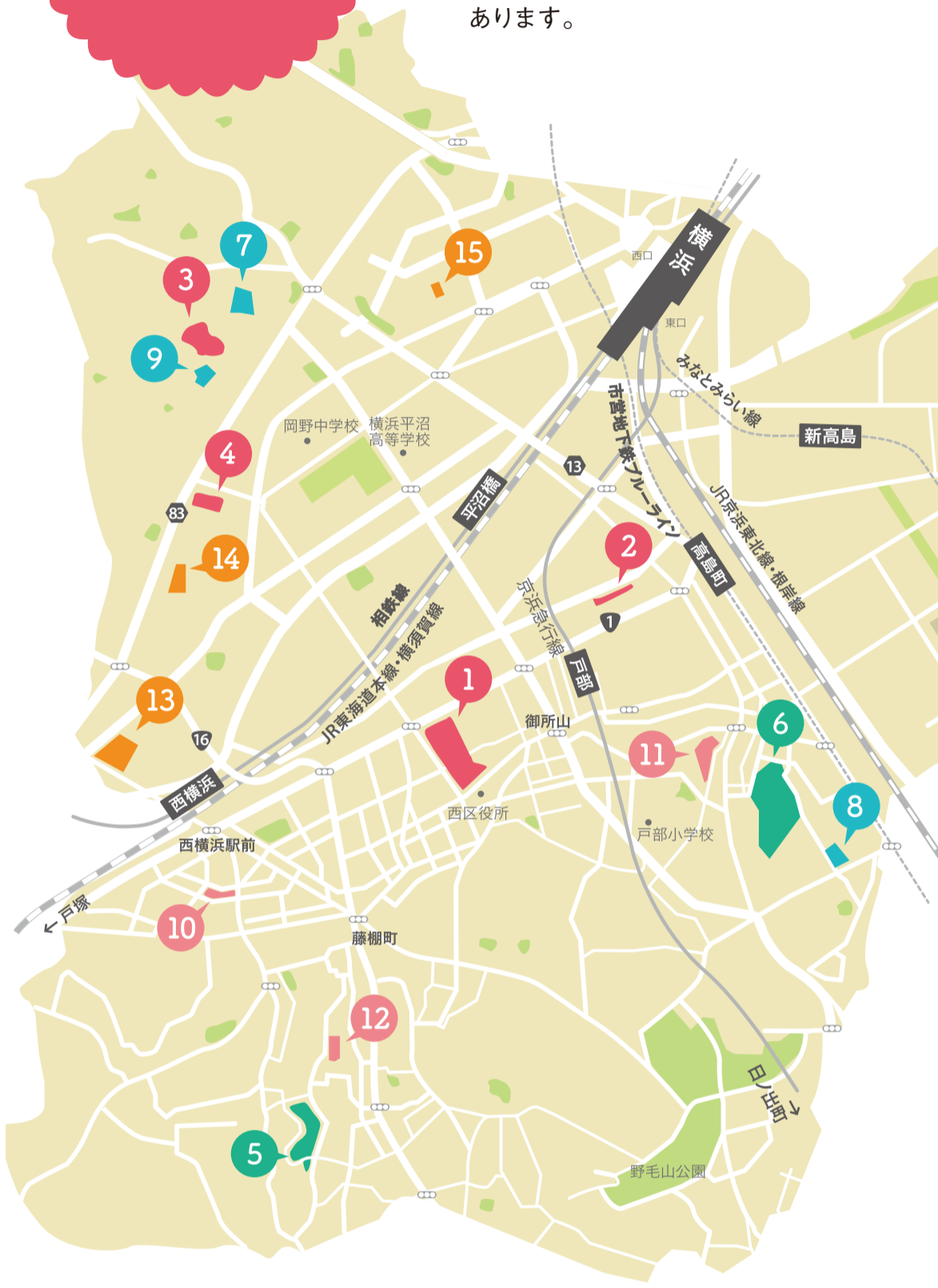
※紹介している公園以外は緑色

他にも癒やしや季節の移ろいを感じさせてくれる緑や花が美しい公園、大型遊具や健康遊具に特徴を持つ公園もあります。