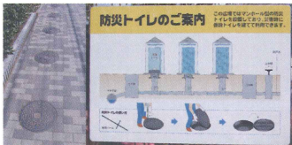
初音森公園マンホールトイレ 平成20年3月見学会実施

防災まちづくりに取り組んでいる地域、団体を訪問し情報・意見交換をして、まちづくり協議会の活動の参考にして行きます。また他からの見学会・研修会も受入れて行きます。