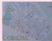
青：安心と感じた所

平成 25 年 7 月 28 日実施 西戸部 2-1: 12 名 羽沢西部: 13 名 横浜市: 2 名 西区: 3 名 コーディネーター: 1 名 合計: 31 名