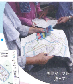
防災マップを 持って..