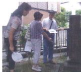
第2回町内減災オリエンテーリング で雨水タンクの説明を聞く参加者

⑤井戸、かまどベンチなどの活用方法を検討し、今後の防災施設の設置及び維持管理を検討して行きます。災害時の生活用水の確保としての井戸の活用、炊き出し用に設置した西戸部公園のかまどベンチの活用を推進します。