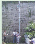
行き止りがある 7m の町内 最高の擁壁を見上げる。