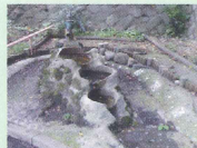
雨水利用の貯水井戸。 (平成 20 年度事業)