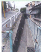
緊急時に使えるか注意 が必要な狭い道。