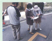
坂道の消火栓が四角い事を確認。