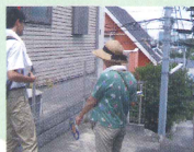
「この辺から階段が始まると安全ね」