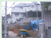
入り口は 4m 道路に成るが、 この先は 3 本の狭い道路。