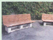
災害時に炊事が出来る「かま どベンチ」