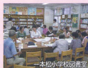
一本松小学校図書室

ゴールは一本松小学校の図書室 歩いてきた道を地図上で確認、 危険と感じた所、安心を感じた 所に印をつけ、それぞれの感想 を出しあいました。