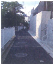
改善整備された狭あい道路