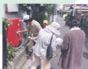
消火栓の中身を確認。