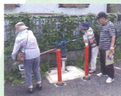
生活用水の井戸を確認。 (平成 21 年度事業)