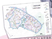
(区の助成で作成、平成 24 年度事業)

ゴールは一本松小学校の図書室 歩いてきた道を地図上で確認、 危険と感じた所、安心を感じた 所に印をつけ、それぞれの感想 を出しあいました。