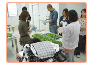
ガッツ・びーと西