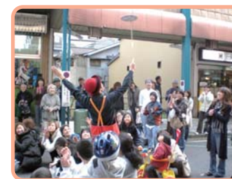
ハートフル商店街