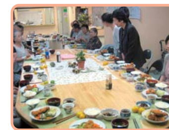
生活支援センター西