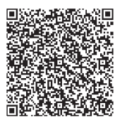
▲关于就学援助制度的通知