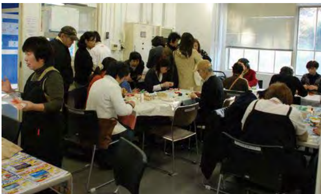
↑グループちょっぴんのワークショップ