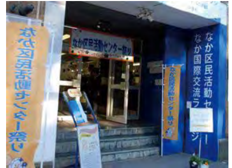
↑お祭り仕様に姿を変えたセンター入口