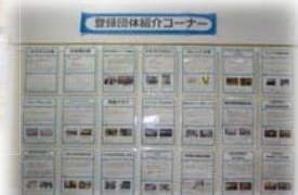
登録団体紹介シートの掲示