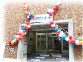
センター入口も華やかに！