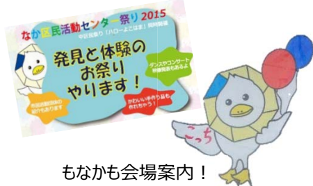
もなかも会場案内！

ハローよこはま会場のテントブース 団体の活動 PR や、なかく街の先生による バルーンアート・フェイスペイント・おもしろ 仮面づくりなど、大人気でした！