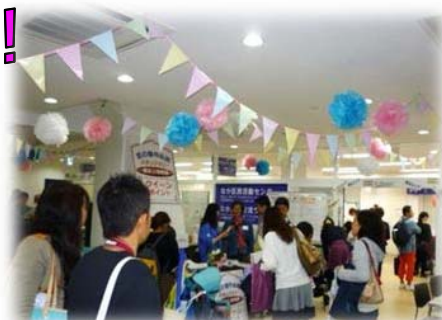
展示・ワークショップエリア

企画から実施まで盛り上げてくださった企画 委員の皆様及び出展者の皆様、ご参加・ ご協力、誠にありがとうございました！