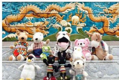
みんなで、ハイチーズ!

今日一緒に散歩した羊の「メーくん」は、北海道から横浜へ旅行に来ているぬいぐるみです。たくさん写真を撮ってもらい思い出がいっぱいできたようです。