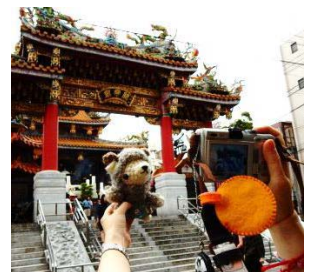
北海道から参加のメーくん