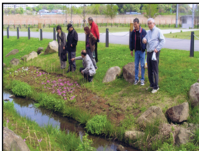
新横浜公園で、開花状況を見るメンバー