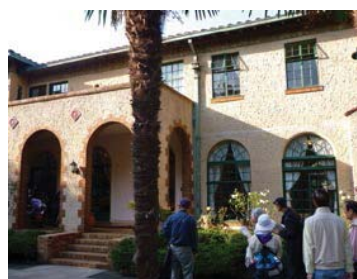
西洋館巡りで訪れたベーリックホール