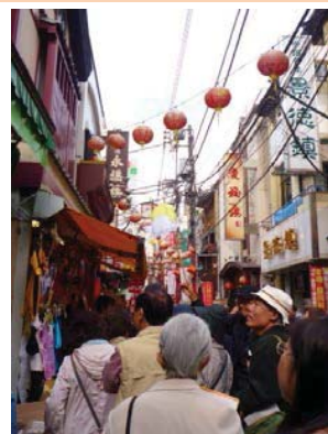
中華街の路地散策