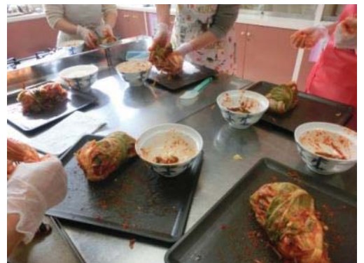
出来上がったキムチ【本牧地区センター提供】

本牧地区センターの「スローフードを一緒に」の事業の一コマとして、12月22日(木)にキムチ作りが行われました。キムチを作りながら、さまざまな薬味を合わせる韓国タレ「ヤムニョム」について学び、また、作りたてのキムチと、先生が事前に漬け込んだ発酵期間の異なるキムチを食べ比べ、発酵による味の変化なども体験できた、とても興味深い講座となりました。「とてもチャームな先生。丁寧な指導でまた参加したい」「今度は韓国の家庭料理も習いたい」と参加者のみなさんとても楽しまれた講座となりました。「スローフードを一緒に」シリーズ講座のお問合せは、本牧地区センターへ。