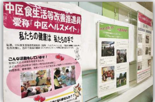
2月展示 中区食生活等改善推進員(ヘルスマイト)

展示コーナーで作品や活動紹介を披露して下さる団体を募集しています。メンバー募集にもご活用ください。★展示希望の登録団体はセンターへ