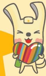
横浜市資源循環局 マスコット イーオ