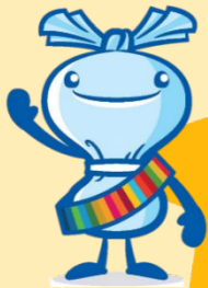
横浜市資源循環局 マスコット ミーオ