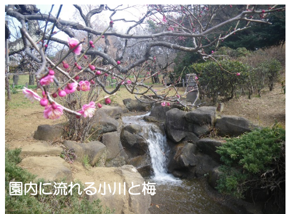
園内に流れる小川と梅