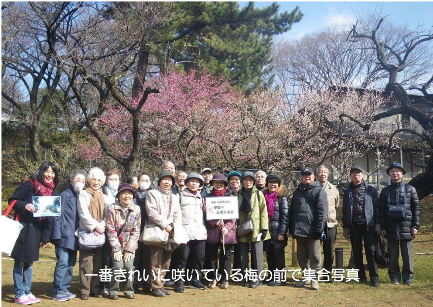
一番きれいに咲いている梅の前で集合写真