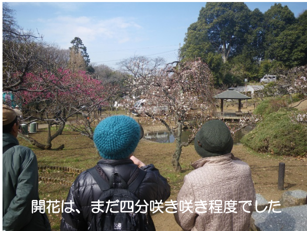
開花は、まだ四分咲き咲き程度でした