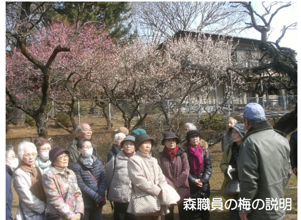
森職員の梅の説明

今年の冬は寒い日が多く、開花が遅れているようですが、きれいに咲いている梅の花や、香りを楽しみ、春の近づきを感じることができました。