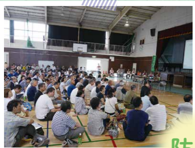
▲地域防災拠点訓練 (鴨居中学校)

防災訓練実行委員会が地域の皆さんの意見を取り入れ防災訓練をより実践的なものに進化させていきます。