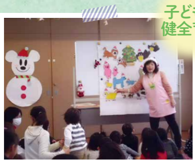
▲子育てサロン コガモひろば