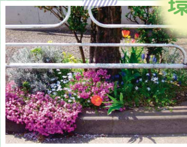
▲白山グリーンクラブによる花植え活動