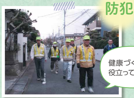
▲パトロール活動の様子