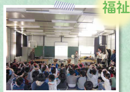
▲子どもたち向け 認知症サポーター養成講座の開催