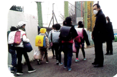
▲中山自治会登下校見守り