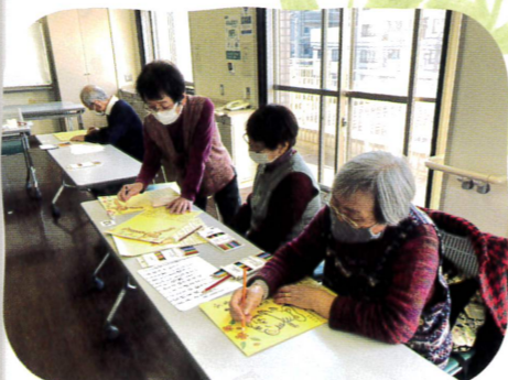
▲リハビリ教室ぬくもり