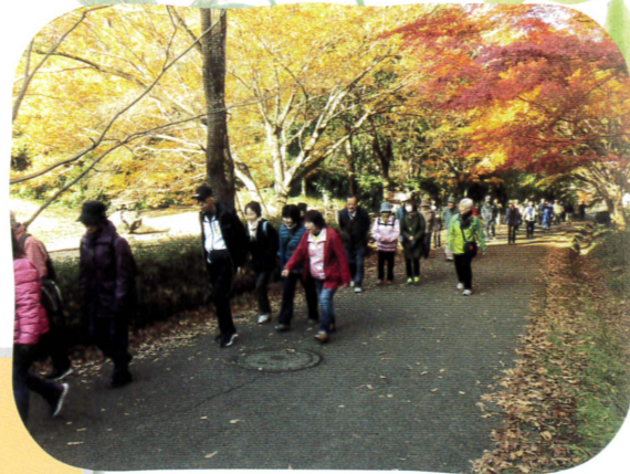
▲町ぐるみ健康づくり教室