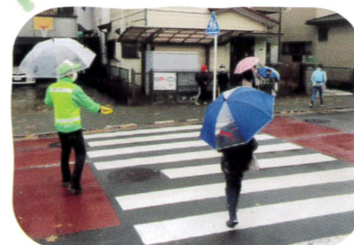
▲上山自治会登下校見守り

「子どもたちに安全で安心な学校生活を送って欲しい」と願い、自治会ごとに登下校の見守り活動をしています。子どもたちの明るい笑顔とあいさつに日々パワーをもらっています。あなたも一緒に見守りの輪に参加してみませんか。子どもだけでなく保護者や地域の大人たちも互いにあいさつを交すまちにしませんか？