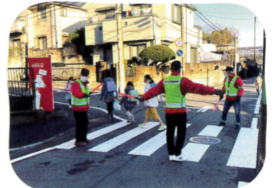
▲寺山町自治会登下校見守り