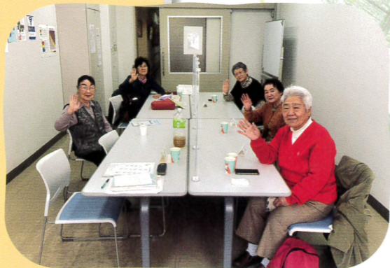
▲すずらん会(介護者のつどい)