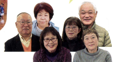
▲地域ふれあいフェスティバル実行委員会

みなさん一緒にまちを育てませんか？ 地域で見守り・ささえ愛の輪(和)を広げましょう あなたのご参加をお待ちしております