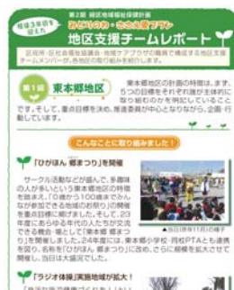
<広報みどり5月号コラム>