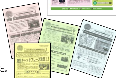
<地区別計画推進委員会通信>

通信には今後の取組の方向性なども掲載し、より多くの方に読んでいただけるよう、地域での回覧や全戸配布などを行いました。