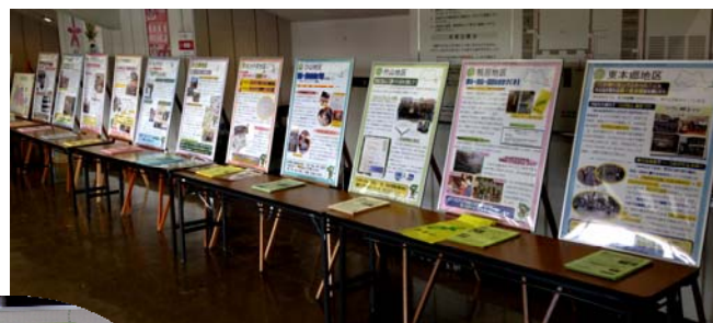
<平成26年2月21日(金) 社会福祉大会でのパネル展示の様子>

また、各地区のパネルは、地域ケアプラザなどに継続して展示しています。より多くの方に、地域福祉保健計画や地域の取組に理解を深めていただくのに役立っています。