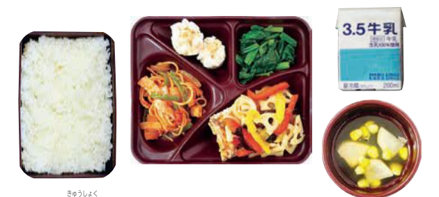
▲中学校給食イメージ

T そうなんです。給食ってとてもすてきなことだと思います。小学生のころ、一か月の献立表が教室にはられて、それを見るのがすごく楽しみでした。みんなで食べる給食の楽しさだったり、学校で放送委員の放送があったりだとか、そういうことがよい思い出になります。給食があれば授業もがんばれますよね。あと1時間がんばったら給食だ!みたいな(笑い)。