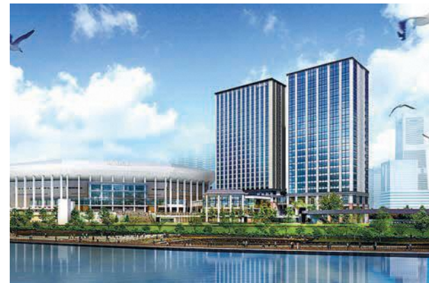
▲2023年秋には音楽施設Kアリーナもオープンする予定（イメージ）

Y 高城さんがこれから、もっともっと活躍するように心から応援しています！私も横浜市長として、ひとりでも多くの方が、高城さんのように横浜の魅力を感じて、好きになってくれるように、全力をつくしていきます。