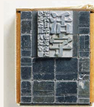
▲展示タイトルを活字で組んだ組版（組版の画像を反転）

いま行われている展示では、活版印刷と明朝体活字の始まり、活字と印刷術がどのように日本に来たか、そしてその後の発展の歴史をたどります。いま私たちはデジタルフォントにかまかれています。文字文化の原点を見にきませんか。