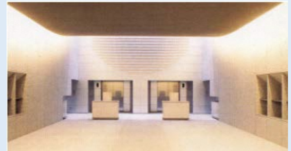
▲【参考】北部斎場 炉前告別室