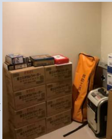
▲拠点階の防災倉庫