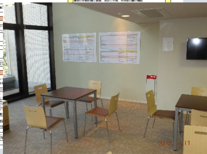
▲活動拠点の壁に掲示