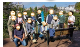
草刈り・清掃の参加者

遊水池周辺の清掃活動・テラス裏花壇づくり等を行いました。今後、浚渫工事や周辺整備も行われます。