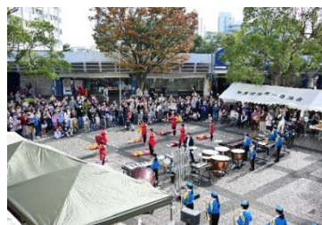
下野庭小学校マーチングバンド演奏

当日は下野庭小のマーチングバンド、キッズダンス、太鼓の演奏や飲食の出店、大学生によるスタンプラリーなどで多くの方が訪れ賑わいました。