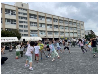
園児によるダンス

当日は飲食の出店や園児のダンス、和太鼓の演奏が行われ、夜には花火が打ち上げられました。訪れた多くの方が楽しみました。