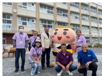
住宅連合の皆様と栗原区長