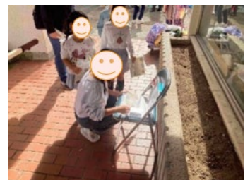
緑道を巡るスタンプラリー