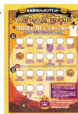
商店のスタンプ集め

10月25日、26日に野庭住宅と商店街にてハロウィンイベントが行われました。野庭住宅A街区の集会所では、たくさんの子供たちが、お菓子をお目当てに大集合しました。また、商店街イベントでは、子どもたちが参加店を巡るスタンプラリーや、仮装コンテストも行われました。野庭住宅A街区と商店街で相互に来場者を誘導し合い、互いのイベントを盛り上げました。