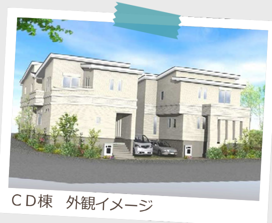
C D棟 外観イメージ