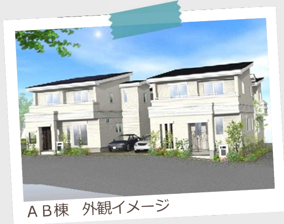
A B棟 外観イメージ